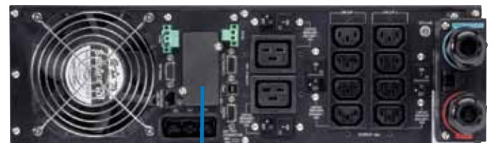
ИБП Eaton 9PX с сетевой картой Network Card-MS (внизу)