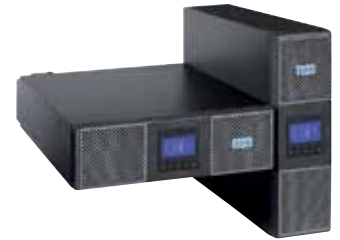
ИБП Eaton 9PX

Все модели поставляются с Network Card-MS и комплектом креплений для монтажа в 19" стойки. ИБП 9PX мощностью 8000 ВА и 11000 ВА стандартно комплектуются внешним сервисным байпасом.