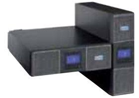
ИБП Eaton 5PX